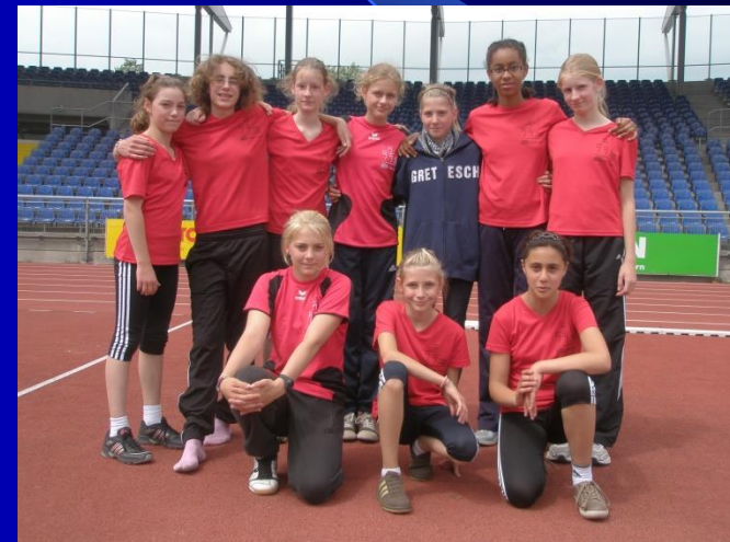
Vizelandesmeister: Die WK IV- Mädchenmannschaft