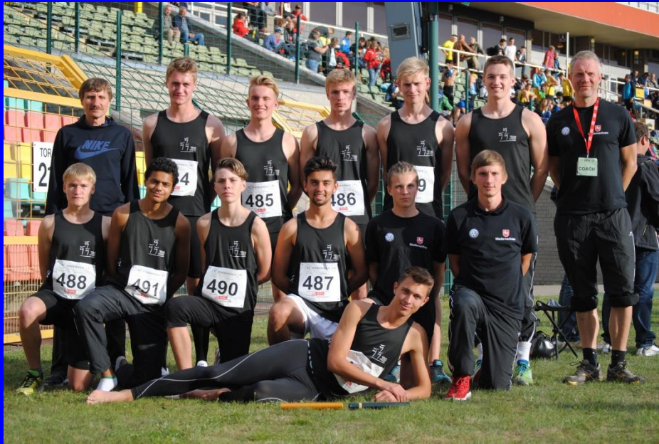
8. Platz : Die WK II- Jungenmannschaft 26.03.17