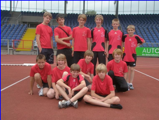
Landesmeister: Die WK IV-Jungenmannschaft