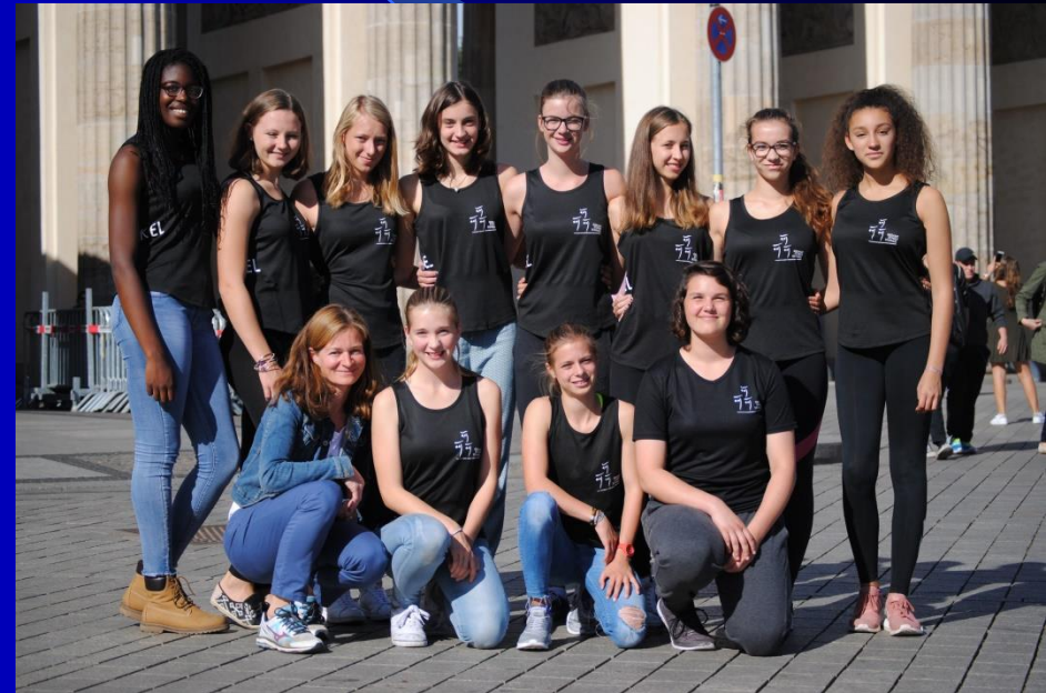
11. Platz: Die WK II- Mädchenmannschaft 16